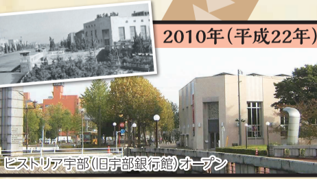
ヒストリア宇部(旧宇部銀行館)オープン