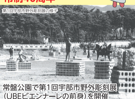
第1回宇部市野外彫刻展の様子