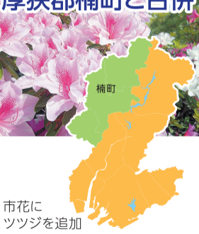
市花に ツツジを追加