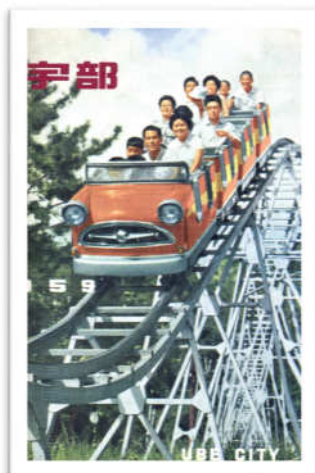
市勢要覧表紙 ジェットコースター