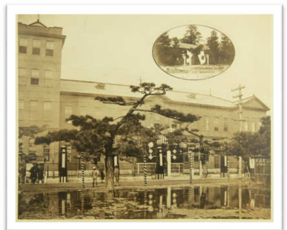
昔の宇部市役所 (市制写真帳)