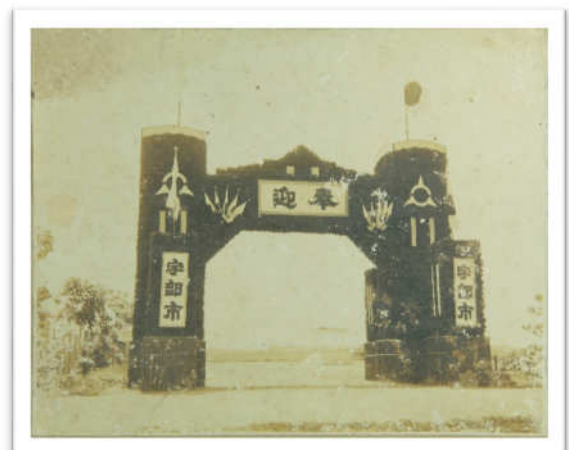
皇太子行啓記念写真帳から